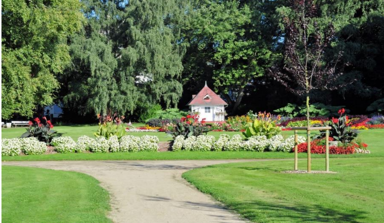
Kurpark als Bewegungsraum

Die Naturerfahrungen verbinden wir in unserer pädagogischen Arbeit mit Angeboten und Projekten der Gesundheitsförderung (z.B. zur gesunden und genussvollen Ernährung, Teilnahme am zahnärztlichen Patenschaftsprogramm, Beobachtungs- und Experimentierstunden mit Kennenlernen der Elemente usw.)